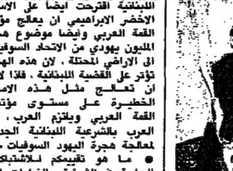
الرئيس الحزب والوزير الخليل المخرج المطلوب للموضع الحالي (محمد عزائق)